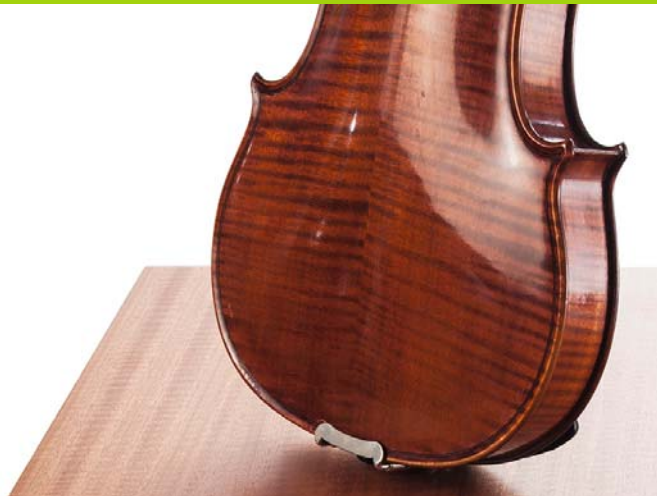
DANZER Figura Sapele

Die ausgewählten Fachvorträge zeigen Schönheit und Design sowie Exklusivität und Authentizität des hochwertigen Werkstoffs Furnier. Verbunden mit diesen Attributen verbinden die Experten die Perfektion in der heutigen Verarbeitung von Furnier. In diesem Rahmen werden dementsprechend auch neue furnierte Produkte vorgestellt. So positioniert sich der Werkstoff Furnier als eigenständiges, entgegen aller Plagiatsversuche nicht kopierbares Material für anspruchsvolle Innenarchitekten und Designer, Verarbeiter, Fachhändler und Verbraucher.