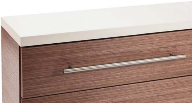
DANZER Linea Walnut

Im Rahmen der interzum laden der Gesamtverband Deutscher Holzhandel e.V. (GD Holz), die Initiative Furnier + Natur e.V. und die Koelnmesse am 14. Mai 2013 zum 3. Europäischen Furnier Forum ein. Das Branchenmeeting, zu der die Veranstalter wieder viele Multiplikatoren aus dem In- und Ausland erwarten, findet in der Halle 4.2 statt.